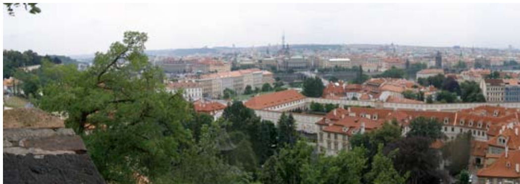
Udsigten over Prag fra Borgens østlige hjørne.